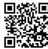
ZOOMアプリ ダウンロード