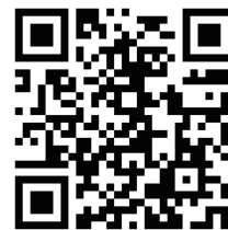
事前登録サイト QRコード